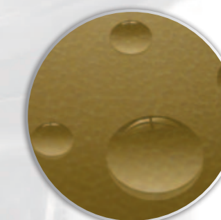
povrch s použitím impregnace