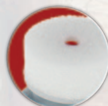
detail aplikační hlavy kondicionéru